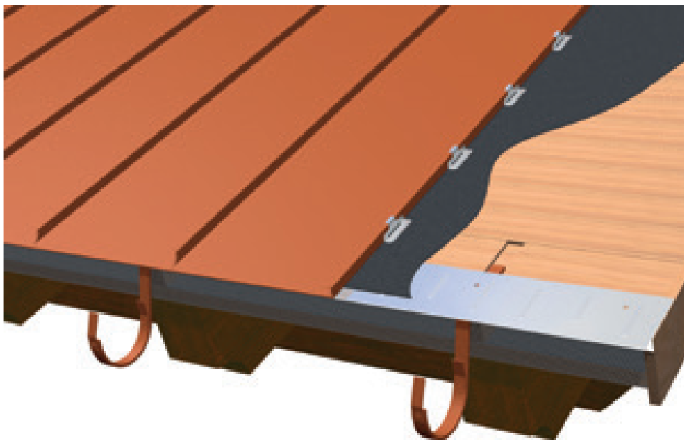
Particolare della doppia aggraffatura

La molteplicità di sviluppi ottenibili e le disposizioni delle sezioni, aprono molteplici possibilità a livello decorativo. L'altezza minima dell'aggraffatura finita, pari a 25 mm, risulta dalla piegatura laterale delle lamie che, mediante diverse operazioni, vengono congiunte per formare una doppia aggraffatura. Tale tecnica offre un'elevata sicurezza per l'impermeabilità alla pioggia e viene impiegata nei tetti con una pendenza ridotta, fino a 5°.